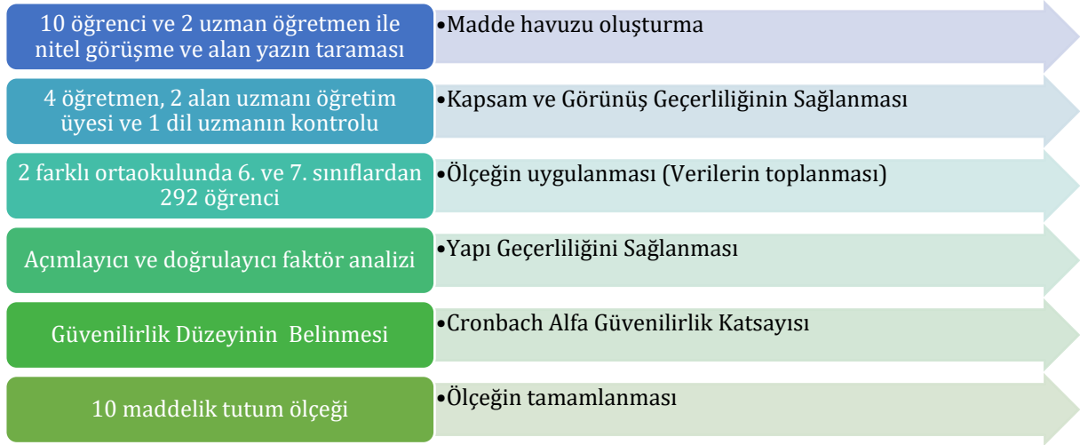
Şekil 1: Çalışma süreci