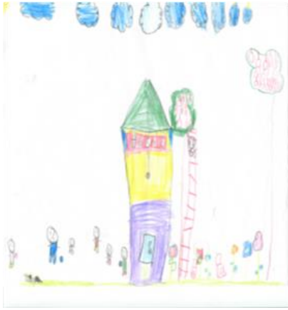
Resim 1. E1 (7Y.)

Tablo 2’de, görüldüğü üzere mutluluk temalı resimlerde çok az sayıda çocuk (n=3) insan figürleri çizmiştir (Bkz. Resim 1, 2, 3). Yapılan görüşmede E1 “Bu ben, kardeşlerim, abim”, E3 “Bu ben ve abim” ve E5, “Bu abim, ben” ifadeleriyle çocuklar bu çizimlerde kendilerini, kardeşleriyle ve abileriyle çizdiklerini ifade etmişlerdir. Öte yandan sorgulanması gereken çocukların neden resimlerde anne ve babalarını değil de kardeş ve abilerini çizdikleri ve neden resimlerde büyük çoğunluğunun (n=8) insan figürünü çizmedikleridir. Çocuklar ile yapılan görüşme neticesinde E2’nin “babam yok, orda [Afganistan] gelecek”, “Abim ve babam bizle gelmedi” (E8) ifadeleriyle anne hariç babalarının ve/veya bazı kardeşlerinin geldikleri ülkede kaldığı tespit edilmiştir. Farklı şartlardan dolayı onlarla halen görüşemedikleri ve haberleşemedikleri anlaşılmıştır. Malchiodi’ye (2005, s.221) göre aile resmi çizmek insan figürlerini resmin bir parçası haline getiren 4-6 yaş grubu çocuklar hariç diğerleri için kendiliğinden gerçekleşen bir durum değildir. Dolayısıyla kendi akranları dışında abi ve kardeşlerini çizmeleri aralarında çevrelerine göre daha dinamik ilişkinin varlığını düşündürmektedir.