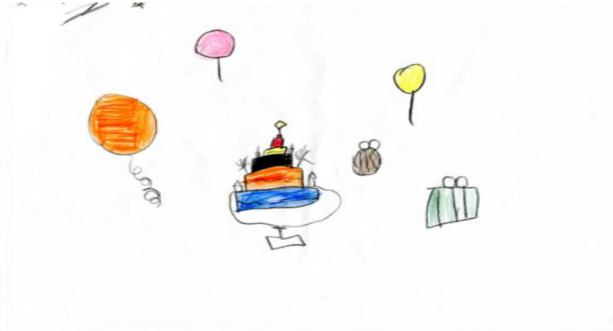
Resim 11. E4 (9 Y.)