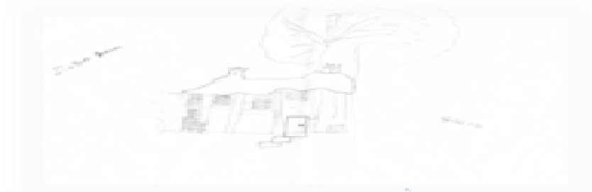
Resim 9. E8 (10Y.)

Çocukların çizimlerinde ev, sık çizilen figürlerden biri olarak erken yaşlardan itibaren görülür. Ev çocuğun duygusal yaşam alanının olduğu merkezdir (Yavuzer, 2009). Benzer şekilde sığınmacı çocukların resimlerinde de çok sık olmasa da on bir çocukta dördünde ev çizimlerine rastlanmaktadır (Bkz. Resim 1, 5, 6, 9). Bu evlerin şematik evre (Bkz. Resim 1, 6) ve gerçekçilik evresinde (Bkz. Resim 5, 9) olan çocuklar tarafından büyük boyutlu olarak çizildiği görülür. Özellikle gerçekçilik evresinde çok rastlanılmasa da şematik evrede çocukların resimlerinde boyutları abartma çocukların özgürce kullandığı bir unsurdur. Önem vurgulamak için boyutta çeşitlilik bu yaşta normal kabul edilir (Malchiodi, 2005, s.132). Bu çalışmada gerçekçilik evresinde olan çocuklar tarafından da çizilen bu büyük boyutlu evler, travmatize bir durumun yansıması olabilir. Nitekim K3 görüşme esnasında büyük boyutlu olarak çizdiği evleri “Bu Irakta ki evimiz, evimizin bahçesi, bu da bakkalımız, babamındı”, “çok güzel burası”, “özledim evet” ifadeleriyle (Bkz. Resim 5), evlerinin bahçesi olduğunu ve bahçede bakkallarının bulunduğunu, babasının orayı çalıştırdığını ve geçmişte yaşadığı yeri özlediğini ifade etmiştir. Yalnız E8’in çizdiği ev diğer çocuklardan farklılık göstermektedir (Bkz, resim 9).