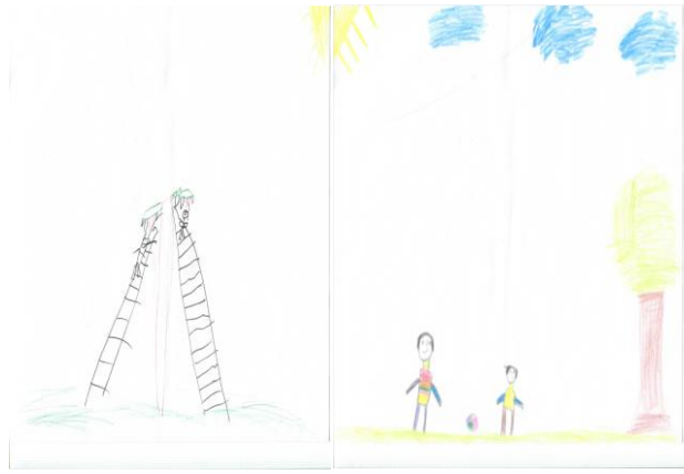
Resim 2. E3 (9Y.)