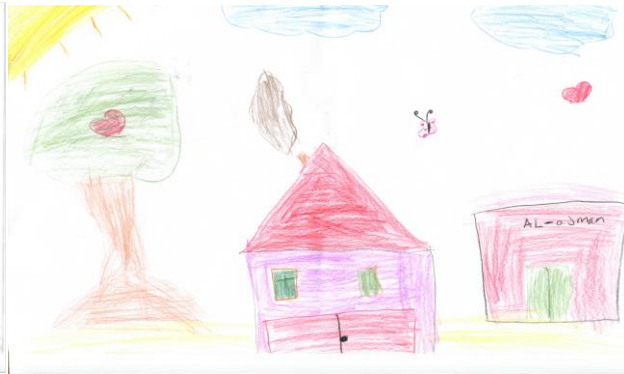
Resim 5. K3 (10Y.)