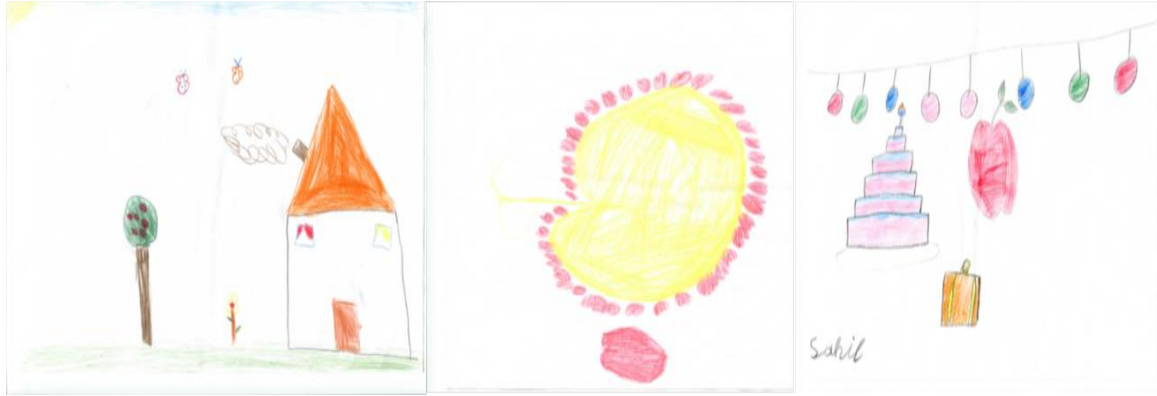
Resim 6. E6 (9Y.)

Tablo 4’te görüldüğü gibi elma ağacı ve elma sığınmacı çocukların çizimlerinde sık çizilen unsurlardan biridir. Bu iki simgesinin aşağıdaki resimlerde çok farklı mekânlar içerisinde ve çok farklı boyutlarda çizildiğini görmek mümkündür.