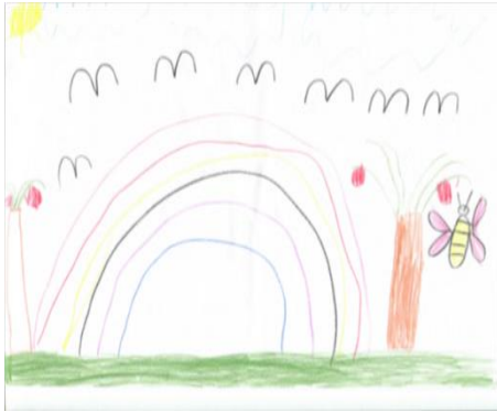
Resim 4. K1 (7Y.)

Çocukların çizimlerinde mutluluğu simgeleyen diğer dikkat çekici göstergeler kuşlar (Bkz. Resim 4) ve kelebeklerdir (Bkz. Resim 4, 5, 6). Kuşlar sembolik evrede olan 3 çocuktan biri (Bkz. Resim 1), kelebekler gerçekçilik evresinde olan 9 çocuktan 3'ü tarafından çizilmiştir. Çocuklar bu göstergeleri görüşme sonuçlarına göre geçmişte yaşadıkları mekân içerisinde resmetmişlerdir. Burns ve Kaufman'a (1972) göre çocuk resimlerinde çizilen kuşlar özgürlüğün, kelebekler hayali sevgi ve güzellik arayışını simgeler (Akt. Batı, 2012, s. 89). Di Leo'ya (1983) göre bunlarla birlikte ağaçlar, çiçekler ve güneş; ışık, doğa ve evin sınırlandırdığı dünyaya duyulan ihtiyacın bir sembolü olarak da değerlendirilebilir. Dolayısıyla tüm bu semboller çocukların geçmişte özgür ve mutlu bir yaşamlarının olduğunu düşündürmektedir. Şu anda da sevgi ve mutluluk arayışı içerisinde başkalarının desteğine ihtiyaç hissettiklerini ileri sürmek fazla iddialı bir yorum olmasa gerekir.